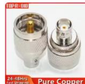
1PC UHF オス - BNC メサアダブ...