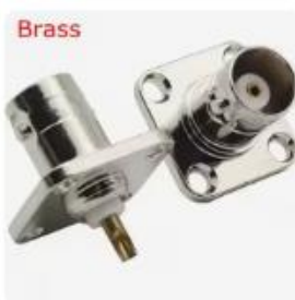
Choice Q9 BNC メス 4 穴フラン...