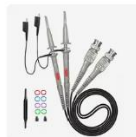
Choice P6100 bncオシロスコー...