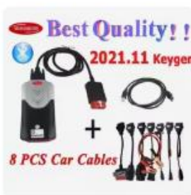
Choice Best Quality! 2021.11 Keygen