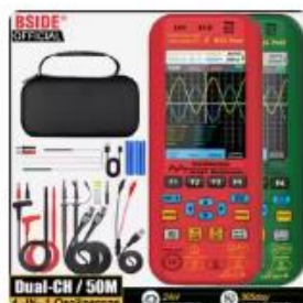
Choice Dual-Channel Oscilloscope