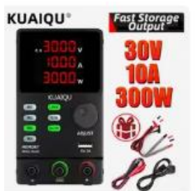
Choice Kuaiqu 30V 10A 実...