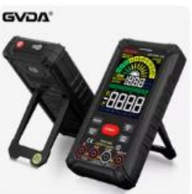
Choice Gvda-プロフェッショナル...