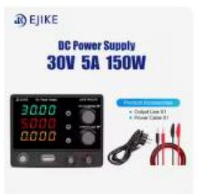
Choice EJKE-DC電源,降圧モジュール,...