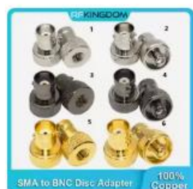
Choice CB ラジオ アンテナ BNC...