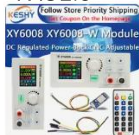
安定化DC電源,降圧モジュール,...