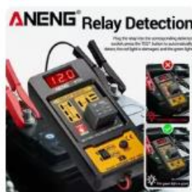
Choice ANENG RT01 ユニバー...