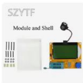
Choice トランジスタテスター,交...