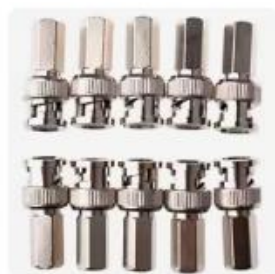
Choice Bncオス同軸コネクタ, ...