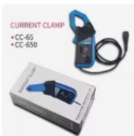
Bncプラグ付き電流クランププロ...