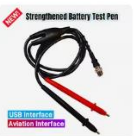
Choice Strengthened Battery Test Pen