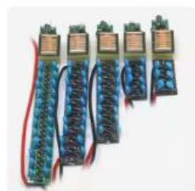
長寿命の高電圧インバーター,5v...