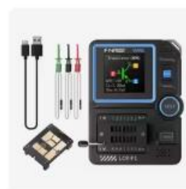
FNIRSI LCR-P1 トランジスタテ...