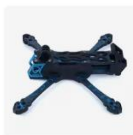
Axflying Manta5 SE 5インチド...