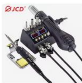
2 in 1 750 ワットはんだステーション...