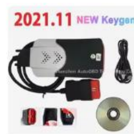
車とトラックの診断ツール,keyge...