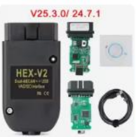
Choice 最高品質 V25.3 VAG ...