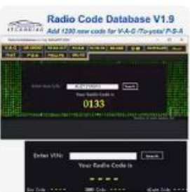
ラジオコードデータベースV1.9 ラジ...