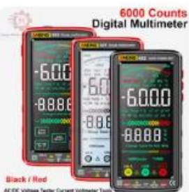
Choice 6000 Counts Digital Multimeter