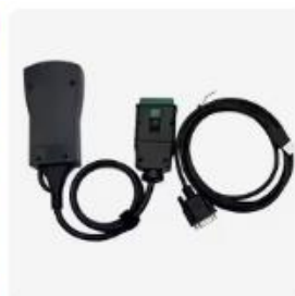
シリコンとブジョーのプロの診断...