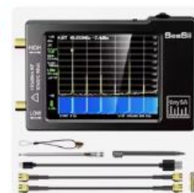
Choice Big Save