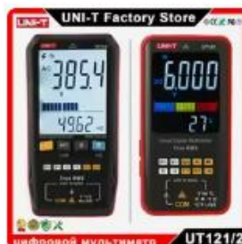
UNI-T UT121 UT122 スマートデ...