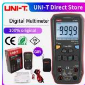
UNI-T UT60S UT60BT スマート...